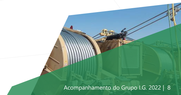
Acompanhamento do Grupo I.G. 2022 | 8