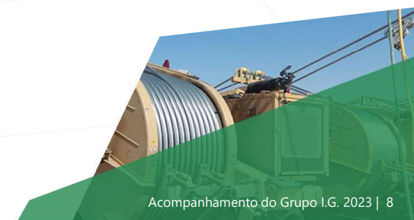
Acompanhamento do Grupo I.G. 2023 | 8