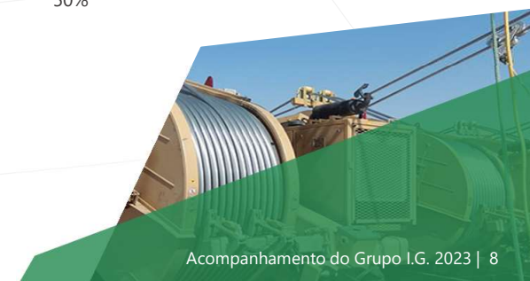
Acompanhamento do Grupo I.G. 2023 | 8